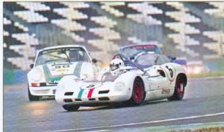
Classée sixième l'Elva précède la Porsche 911 3,0 I RS de Bernard Moreau.