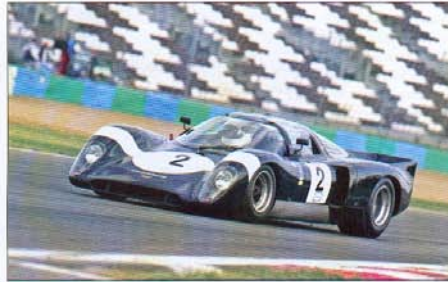
La Chevron B 16 de Quiniou/Bermudes/Hitchins vole vers la victoire.