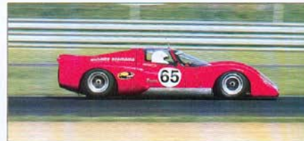
La superbe Chevron B 16 des frères Scemama, une nouvelle auto qui accroche la seconde place.