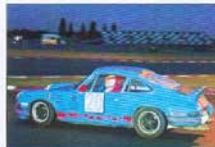
La Porsche 911 2,7 I RS des belges Brasseur/De Ville De Goyet/Marcy confirment un bon début de saison.