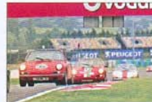
La Porsche de Lusseau (n° 35) ne sera pas classée.