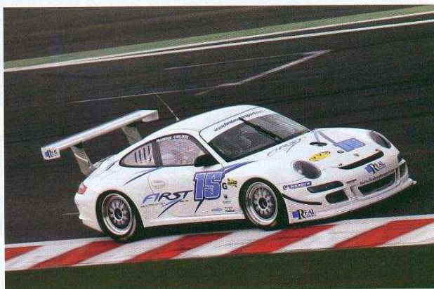
Porsche 997 Cup S de Kelders y Greisch.

En la categoría GT Turismo de la carrera de vehículos modernos, tras