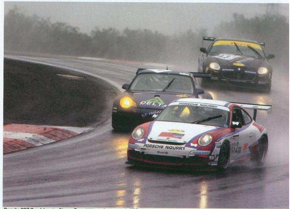
Porsche 997 Cup del equipo Nourry Compétition en la carrera de GT Turismo.

el primer premio de la categoría quedando por delante del 911 2 litros de Kohler. El equipo femenino compuesto por Moureau-Langin y Quiniou quedó en cuarta posición, subiendo así a la tercera plaza de la clasificación provi-