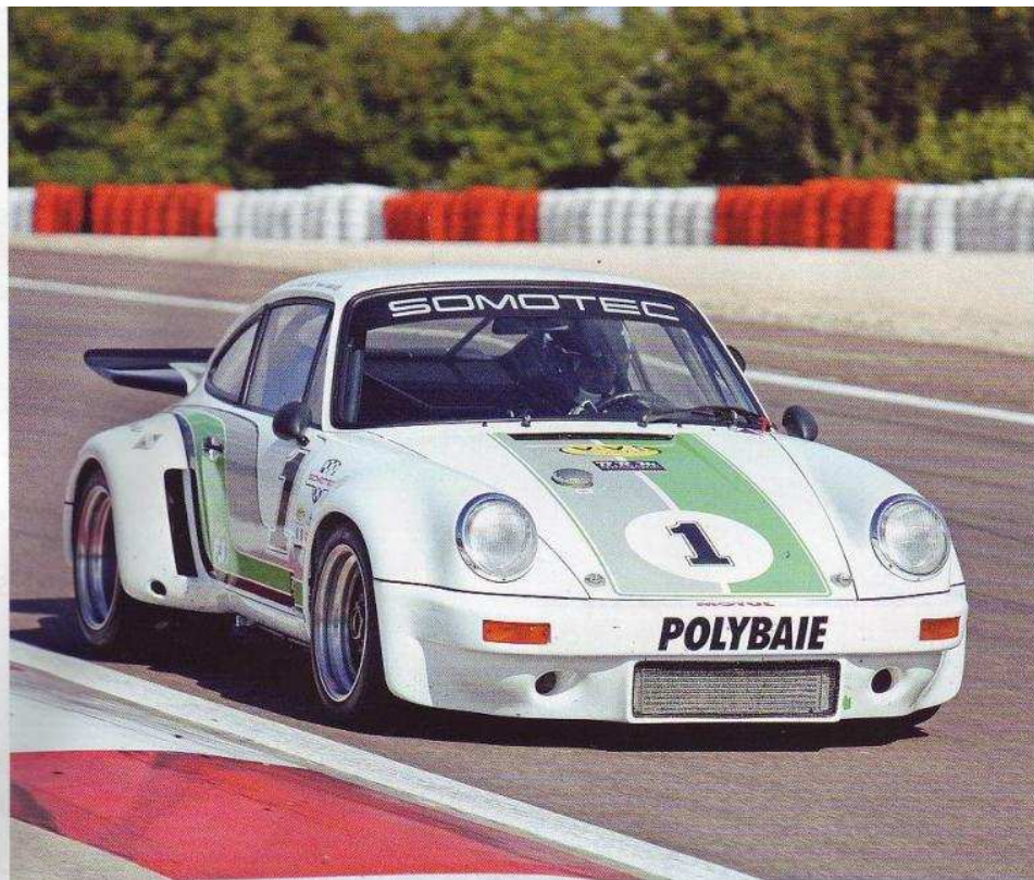
3 Porsche 911 3.0 de Bernard Moreau y Miquel Langin, terceros scratch en la carrera de históricos y vencedores en el Grupo 4.