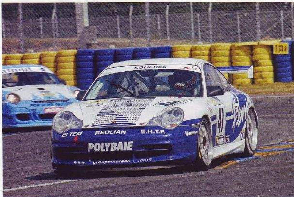
■ Porsche 996 Cup de Arezina y Burel, primeros en GTV4 (Le Mans).