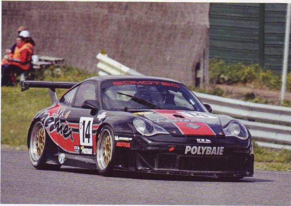
Porsche 996 RSR del equipo Moreau/Langin, cuarto scratch.

A destacar la mayoría abrumadora de Porsche en esta carrera: 17 vehículos sobre un total de 29