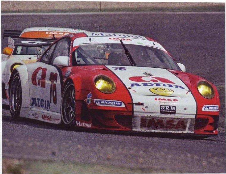
■ Porsche 997 RSR del equipo Narac/Pons, vencedor en la carrera de GT/Turismos.