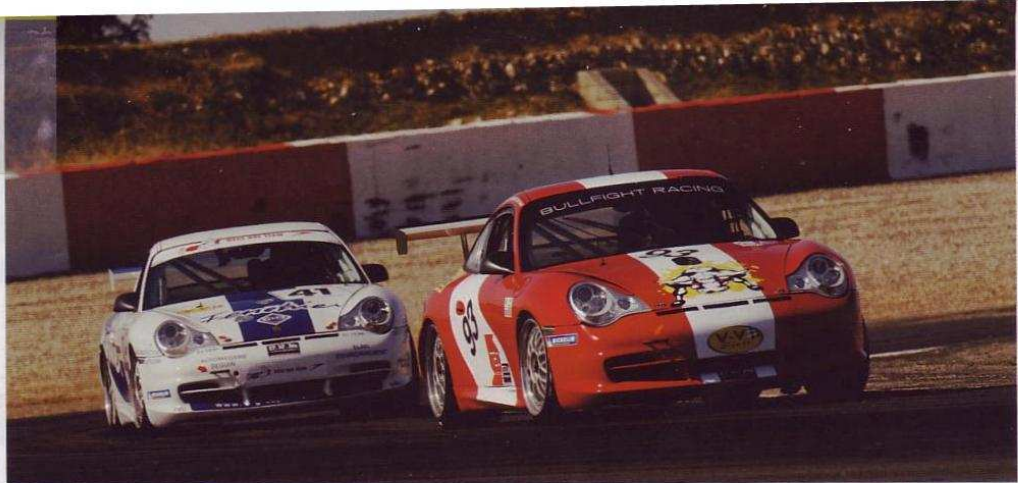
3 Porsche 996 Cup de Decultot/Fontaine, vencedor en la categoría GTV4.