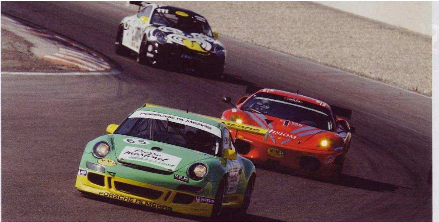
🏎️ Porsche 997 Cup S del equipo Martinet/Almerias (6º absoluto y 3º GTV2) en la carrera de vehículos modernos.

Car realizó varias intervenciones que obligaron a los equipos a replantear sus tácticas.