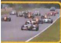
CHALLENGE MONOPLACE V DE V

Credits: www.graphit.fr