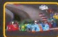
CHALLENGE FUNYO V DE V