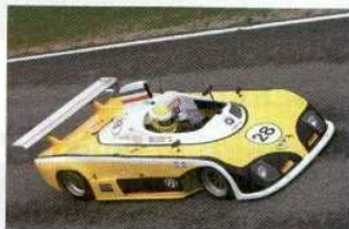
Aunque duró poco en carrera, la barqueta Osella PA 4 de Terrier y Bouvet fue uno de los coches más rápidos.