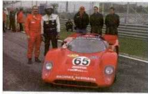
Y enfadados terminaron los hermanos Scemama, con la penalización que les impidió optar a la victoria.