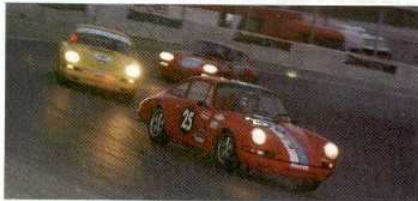
Podría ser la Porsche Cup de hace unas décadas. Es la disputada categoría GTS 11, en la que se impulsaron Moreau y Langin.