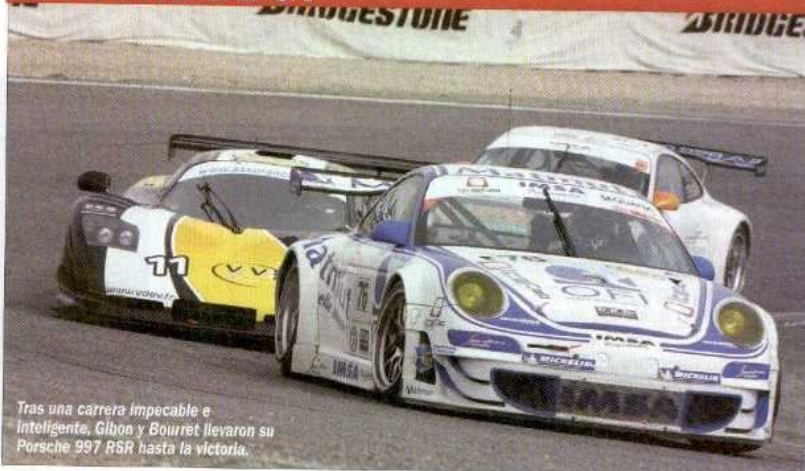
Tras una carrera impecable e inteligente, Gibon y Bourret llevaron su Porsche 997 RSR hasta la victoria.