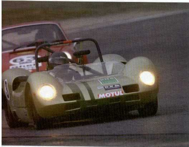
Además de ir deprisa, con solo 2 litros el Elva de Leman y Le Calvez consume poco. Lideró la carrera en algunos momentos y terminó segundo.