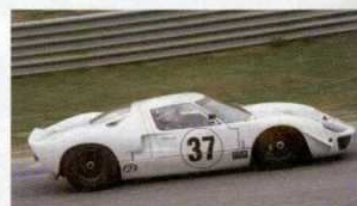
Este es el imponente Ford GT 40 con el que Vincenot y Bachelier fueron primeros en el certamen francés.

tor BMW de 2 litros, llegó a encabezar la prueba en algunos momentos, pero no pudo contra las mayores prestaciones del Lola. Al final debió conformarse con una excelente segunda posición.