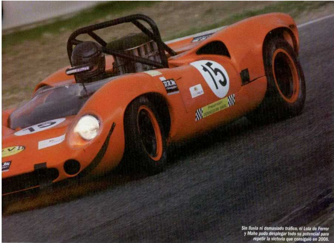
Sin lluvia ni demasiado tráfico, el Lola de Ferrer y Mahe pudo desplegar todo su potencial para repetir la victoria que consiguió en 2008.