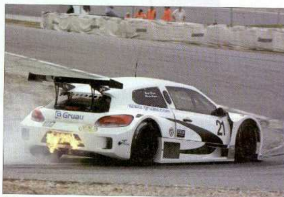
Todavía con muchos problemas de juventud, los GC 10.1. Siluetas con carrocería de VW Scirocco, son sobre todo espectaculares.