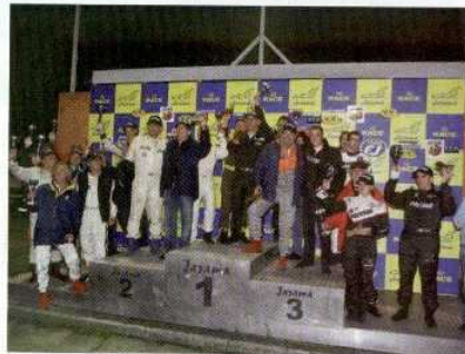
En el podio tras la carrera, los vencedores de las diferentes categorías, que son muchas. Hay trofeos para casi todos.