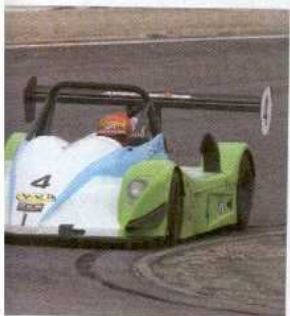
El piloto de Fórmula 1 Alex Caffi se ha vuelto a andar el casco en este certamen. Solo pudo terminar décimo.

en el que la salida del coche de la pista neutralizaba las diferencias y las cosas al rojo vivo.