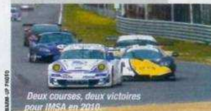
Deux courses, deux victoires pour IMSA en 2010.