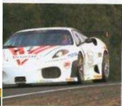
L'équipage Pagny-Perrier a dû cravacher pour finir deuxième.