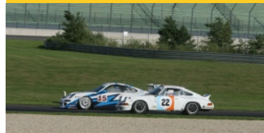
Both winners seem to duel but the 997 Cup S was faster than the 1973 911 2.7 RS.