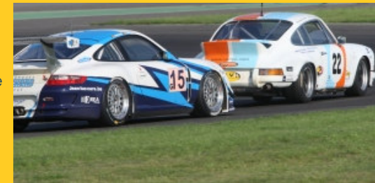
Porsche take pride of place on its ground, in Modern and in Historic as well. ▶