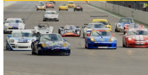
Perfect unity between Historic Cars and Modern GT-Touring Cars.