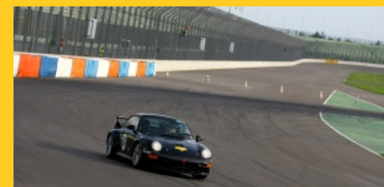
The Porsche 993 RSR still fast.