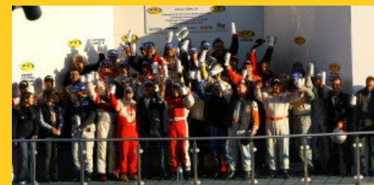
Everybody's happy in the end.